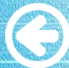
Схема работы Школьной службы примирения